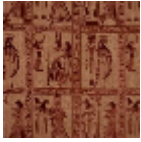
F3654002 Terre cuite