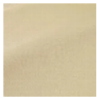
F3756008 Beurre frais