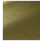
F3756034 At veronese