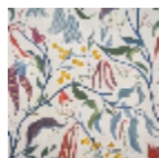
F3787001 Creme 01