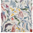
F3787001 Creme 01