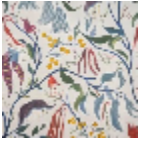
F3787001 Creme 01