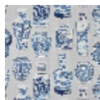
F3806001 Blue porcelain