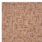
F3815003 Rose des sables