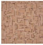
F3815003 Rose des sables