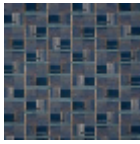
F3816003 Indigo cafe