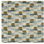
F3816002 Fauve perle