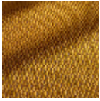
F3818002 Ocre jaune