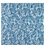
F3829003 Lapis lazuli