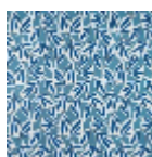
F3829003 Lapis lazuli