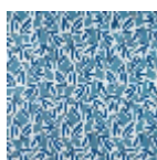
F3829003 Lapis lazuli