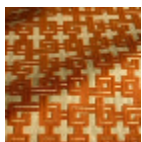
F3833004 Orange brulee