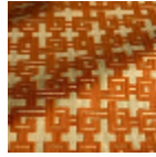
F3833004 Orange brulee