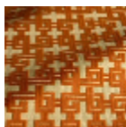
F3833004 Orange brulee