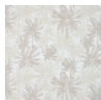
F3837001 Sable blanc