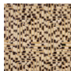
F3843001 bhema sable