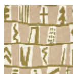
F3856001 qillqay nature