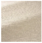
F3865001 E cru