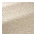
F3865001 E cru