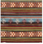
F3966001 MULTICOLOR E