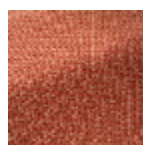
F3982001 PAMPLEMOU SSE