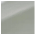
F4019028 MILKY MINT