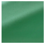
F4019026 MING GREEN