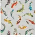
F4021001 MULTICOLOR E