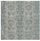
I6526002 Grigio blu