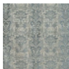
I6526002 Grigio blu