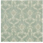
I6624002 002 rialto palazzo