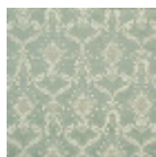
I6624002 002 rialto palazzo