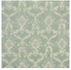
I6624002 002 rialto palazzo