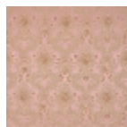
I6624001 001 rialto rosa