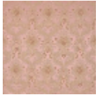
I6624001 001 rialto rosa