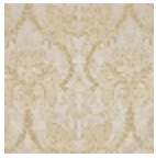
I6625001 Madre perla