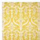
I6627001 Giallo oro