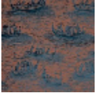
I6628001 Blu reale