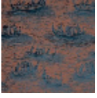
I6628001 Blu reale