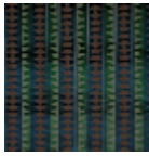
16631003 agostino reale