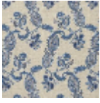
L1688_EGLANT INES_B53_B21_ FE