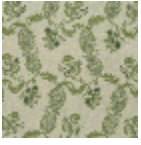
L1688_EGLANT INES_B22_B23 _FA