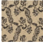
L1688_EGLANT INES_B93_B54 _FB