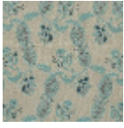
L1688_EGLANT INES_B65_B73 _FM