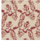
L1688_EGLANT INES_B67_B90 _FE