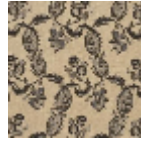
L1688_EGLANT INES_B93_B54 _FB