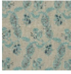
L1688_EGLANT INES_B65_B73 _FM