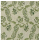
L1688_EGLANT INES_B22_B23 _FA