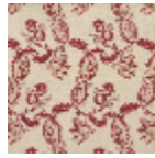
L1688_EGLANT INES_B67_B90 _FE