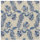
L1688_EGLANT INES_B53_B21_ FE