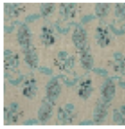
L1688_EGLANT INES_B65_B73 _FM