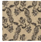
L1688_EGLANT INES_B93_B54 _FB