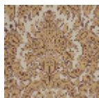
L2018_MURILL O_N3142_N302 4_FC