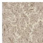
L2018_MURILL O_B26_B04_F E