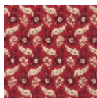
L2141_FEUILLE S_DE_CHENE_ B2_B13_FI