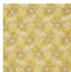
L2141_FEUILLE S_DE_CHENE_ N3010_N3004_ FE