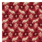
L2141_FEUILLE S_DE_CHENE_ B02_C525_FI