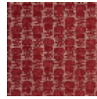
L2407_LES_CH ARDONS_C519 _FM_Verso