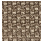
L2407_LES_CH ARDONS_C511_ FE_Verso