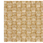
L2407_LES_CH ARDONS_N314 3_FE_Verso