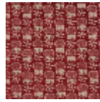
L2407_LES_CH ARDONS_C519 _FM