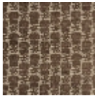
L2407_LES_CH ARDONS_C511_ FE