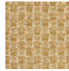
L2407_LES_CH ARDONS_N314 3_FE