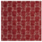
L2407_LES_CH ARDONS_C519 _FM_Verso