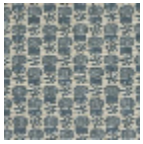
L2407_LES_CH ARDONS_B65_ B39_FE