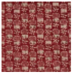
L2407_LES_CH ARDONS_C519 _FM