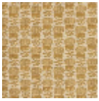
L2407_LES_CH ARDONS_N314 3_FE