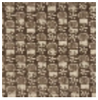
L2407_LES_CH ARDONS_C511_ FE_Verso