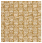
L2407_LES_CH ARDONS_N314 3_FE_Verso