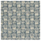
L2407_LES_CH ARDONS_B65_ B39_FE_Verso