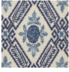
L2924_MURAT _N3011_N3122_ FE