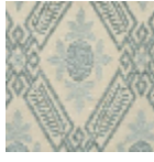
L2924_MURAT _N3016_C537_F E