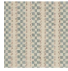
L3077_ALESIA_ N3133_N3013_F E