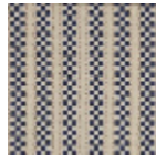
L3077_ALESIA_ N3121_N3013_F G