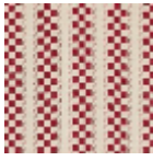
L3077_ALESIA_ N3014_N3015_ FE