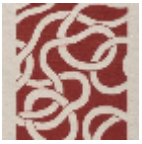
L3117_ENTREL ACS_B41_FE_V ERSO