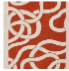
L3117_ENTREL ACS_N3015_FE _VERSO