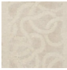
L3117_ENTREL ACS_C501_FE_ VERSO