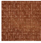
L3294_QUADR ILLE_C517_FG_ VERSO