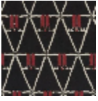
L3475_RANAV ALO_B54_B84 _FE