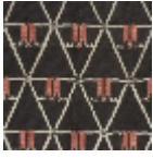
L3475_RANAV ALO_N3002_N 3114_FG