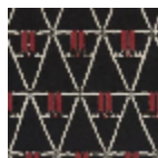
L3475_RANAV ALO_B54_B84 _FE