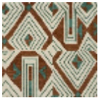
L3559_JAZZ_C 538_C512_C517 _FE