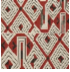
L3559_JAZZ_B 54_B68_B92_B 84_FE