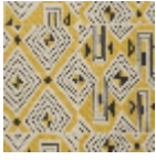
L3559_JAZZ_B 69_B32_N3010 _FE