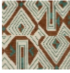
L3559_JAZZ_C 538_C512_C517 _FE