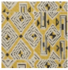
L3559_JAZZ_B 69_B32_N3010 _FE