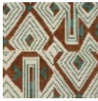
L3559_JAZZ_C 538_C512_C517 _FE