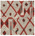
L3559_JAZZ_B 54_B68_B92_B 84_FE