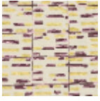
L3568_ATLANT IDE_N3010_N3 117_FE