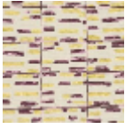
L3568_ATLANT IDE_N3010_N3 117_FE