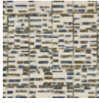
L3568_ATLANT IDE8C533_C54 2_FE