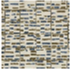
L3568_ATLANT IDE8C533_C54 2_FE