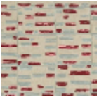
L3568_ATLANT IDE_B90_B30_ FE