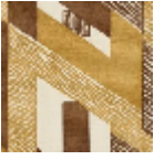
L3569_HYPER BOLE_C515_C5 12_FE