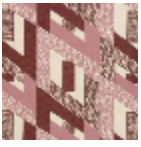
L3569_HYPER BOLE_B09_N3 024_FE