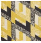
L3569_HYPER BOLE_N3002_ N3010_FE