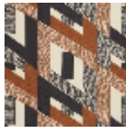
L3569_HYPER BOLE_N3013_ N3002_FE